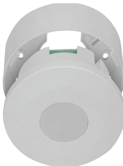
[מצב על גבי הטיח]